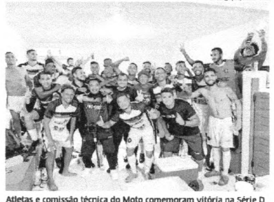
Atletas e comissão técnica do Moto comemoram vitória na Série D

Com um jogo a menos, o Brusque perdeu o aproveitamento de 100% ao ser derrotado pelo Vitória