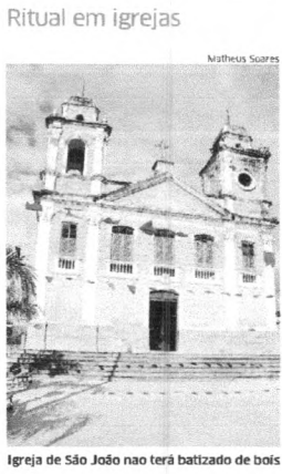
Igreja de São João não terá batizados de bois

Consórcio Covax Maranhão receberá primeiro lote de vacinas Imunizantes se somarão as mais de 244 mil doses do tipo Pfizer já recebidas pelo estado desde o início da pandemia. POLÍTICA 3