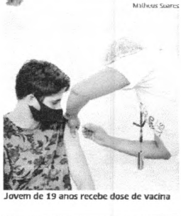
Jovem de 19 anos recebe dose de vacina